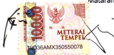
WINOTO Direktur Utama